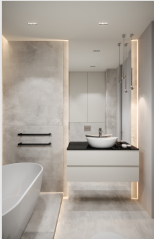
мастер-санузел 6 м 2