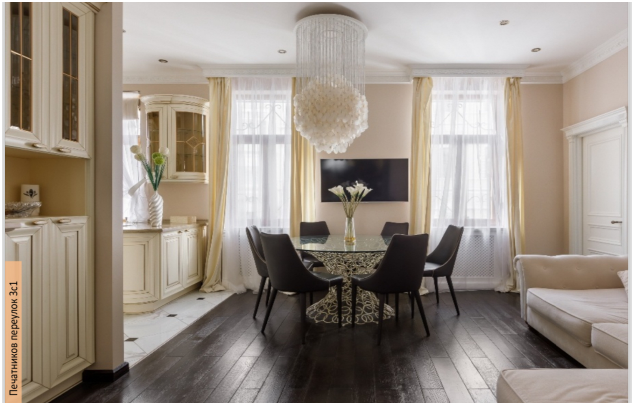
Печатников переулок 3с1